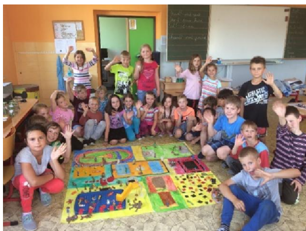
Ilustrační foto: děti ze Základní školy Ostrov

Koncem měsíce června jsme se společně s dětmi ze základních škol tří členských obcí (Horní Čermné, Bystřece a Ostrova) podíleli na přípravě podkladů do žádostí o dotaci na obnovu a budování sportovní infrastruktury, vyhlášené v gesci Ministerstva pro místní rozvoj. Žáci dali průchod své fantazii, kreativité a vznikly tak originální modely nových, rekonstruovaných sportovišť očima dětí. Všichni pevně věříme, že podané žádosti uspějí a nové sportoviště tak budou ku prospěchu všem aktivním sportovcům.