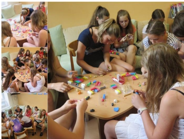
Ilustrační foto: děti ze Základní školy v Horní Čermné