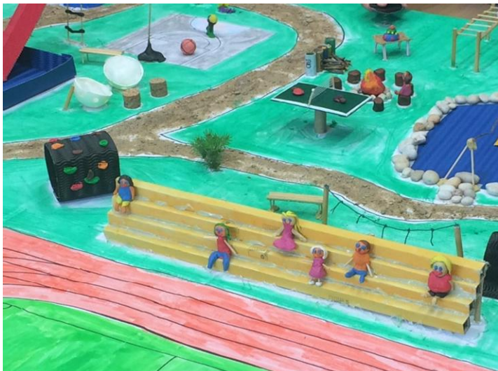
Ilustrační foto: práce dětí ze Základní školy v Horní Čermné